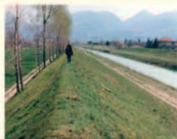
Fiume Topino, presso Pontenovo

I monumenti: a Foligno meritano una visita Palazzo Trinci (splendida dimora signorile con importanti affreschi di Gentile da Fabriano e del Nelli, nonché sede della Pinacoteca e del Museo), la cattedrale di S. Feliciano e le chiese di Santa Maria Infraportas, S. Nicolò (con dipinti dell'Alunno), la Nunziatella (con un dipinto del Perugino), S. Salvatore, S. Agostino, S. Maria in Campis (con opere dell'Alunno e del Mezzastris), il Monastero di S. Anna (con opere del Mezzastris e di Giovanni di Corraduccio). Da segnalare i tanti palazzi nobiliari riccamente decorati e, nelle vicinanze, l'Abbazia di Sassovivo e la chiesa romanica di S. Giovanni Profiamma.