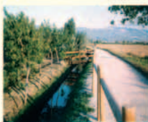
Ciclabile Foligno - Fiamenga