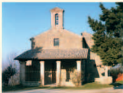
Bettona, S. Gregorio