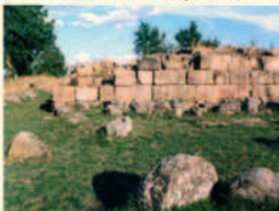
Collemancio, scavi romani

I monumenti: a Pian D'Arca, presso un'edicola votiva, si trova il luogo dove, secondo la tradizione, S. Francesco predicò agli uccelli; nella vicina Cannara il Santo fondò il Terzo Ordine Francescano, detto "dei Continenti". A Limigiano sorgono interessanti resti del castello medievale, che racchiude il caratteristico borgo; da vedere la chiesa romanica di S. Michele Arcangelo, che contiene affreschi della scuola dell'Alunno. A Collemancio da non perdere il borgo (racchiuso entro le mura del castello) ed in particolare, sulla collina sovrastante il paese, gli scavi romani di Hurvinum Hortense, località risalente al II sec. a.C. A Bettona si segnalano le mura urtiche, con i resti di quelle etrusche, il palazzo del Podestà (con la Pinacoteca che conserva opere del Perugino, del Doni, di Luca della Robbia, di Fiorenzo di Lorenzo), la chiesa collegiata di S. Maria Maggiore, l'Oratorio di S. Andrea (con bellissimi affreschi giotteschi), S. Crispolto e l'ex convento di S. Antonio Abate, mulino ad acqua del 1561.