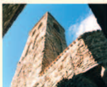
Collemancio, chiesa S. Stefano

Luogo di Partenza: Pian D'Arca di Cannara Arrivo: Bettona