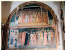
Bettona_oratorio di S. Andrea