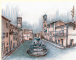
Deruta_Piazza dei Consoli