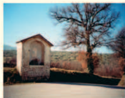
Maestà lungo il percorso

I monumenti: a S. Sabino meritano una visita la pieve di S. Lorenzo (XIII sec.) e l'ulivo secolare di Macciano.