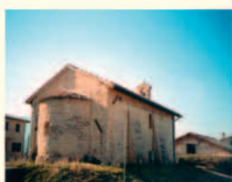
S. Sabino, chiesa di S. Lorenzo