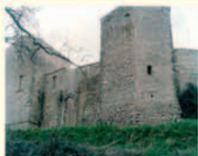
S. Angelo in Mercole

Luogo di Partenza: Petrognano Arrivo: Spoleto