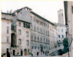
Spoleto_piazza del Duomo

I monumenti: a Terzo la Pieve , i resti del castello trecentesco e la chiesa di S. Lorenzo con affreschi del XIV sec. A Uncinano , i resti del castello e la settecentesca Villa Collicola. A Morgnano , il castello duecentesco, oggetto di una recente trasformazione in struttura ricettiva. A S. Angelo in Mercole , il piccolo borgo racchiuso tra le mura del castello trecentesco e la chiesa di S. Bernardino (XII sec.) con affreschi ed antichi frammenti scultorei. A Spoleto , reperti romani (il teatro, l'arco di Druso e Germanico, il foro, il tempio nella chiesa di S. Ansano, il ponte sanguinario, resti di una casa), chiese (S. Ponziano del XII e XIII sec., il duomo di S. Maria Assunta con affreschi di F. Lippi, S. Gregorio, la Madonna di Loreto, il santuario di S. Filippo Neri, la stupenda rocca dell'Albormoz (seconda metà del 1300), il Museo Archeologico e la Pinacoteca.