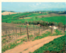
Scacciadiavoli_vigneti presso Villa Scacciadiavoli