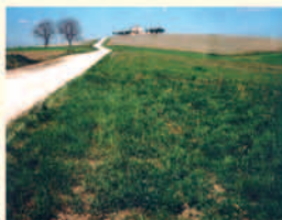
Scacciadiavoli_scorcio del percorso

il paesaggio: dolci colline (altezza massima 351 m. s.l.m.) coltivate a vite, con bei panorami.