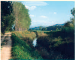
Teverone_sorcio del percorso

I monumenti: a Bevagna da ammirare nel centro storico importanti reperti romani (resti di un teatro, di un tempio, di una casa e bellissimi mosaici) e medievali (come il Palazzo dei Consoli, la chiesa di S. Silvestro, di S.Michele, dei SS. Domenico e Giacomo, la chiesa di S.Francesco e le mura urbiche quasi intatte con porte e torrioni. A Torre di Montefalco la massiccia torre medievale, il ponte del Roscitolo ed i resti di un vecchio mulino ad acqua del 1561.