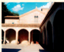
Montefalco, S. Fortunato