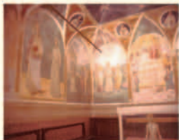
Montefalco, S. Fortunato