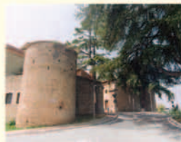
Montefalco, Porta della Rocca

I monumenti: a Montefalco le mura urbane del XIII-XIV sec., il museo-pinacoteca nell'ex chiesa di S. Francesco (XIII sec.) con importanti opere di Benozzo Gozzoli, Melanzio, Nicolò di Liberatore, Mezzastris e del Perugino. Da non perdere le chiese di Santa Chiara (XVII sec.), Santa Illuminata (XIII sec.), S. Agostino (XIII sec.), S. Leonardo e, fuori le mura, il convento di S. Fortunato con opere di Benozzo Gozzoli e Tiberio d'Assisi. A Camiano chiesa di S. Rocco (XIII sec.).