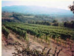
Montefalco_vigneti di S.Marco